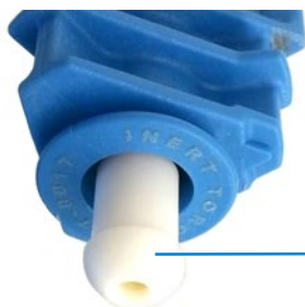
PTFE-Kugelgelenk-Verbindungsstück über dem freien Ende des Aluminiumoxid-Injektors