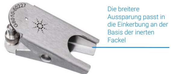
Abbildung 3b: Empfohlene Klemme für die inerte MP-AES-Fackel