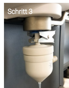
Abbildung 4. Verbinden der inerten Zerstäuberammer mit der inerten Fackel des MP-AES.